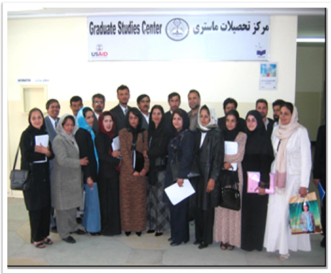
تصویر (۲) اولین دوره فارغان ماستری تعلیم و تربیه