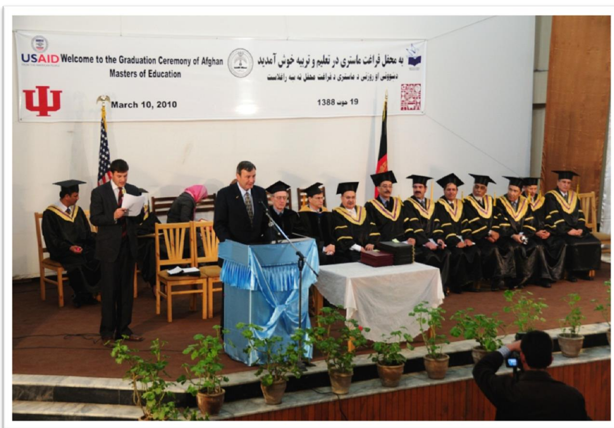
تصویر (۳) محفل فراغت از برنامه‌ی ماستری تعلیم و تربیه